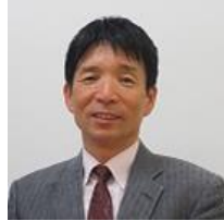
編集責任者 松本幸雄

今月のテーマは話し方ですが、多くの方が、自分の周囲の「人」の問題で悩んでいます。それを解決できるかどうかは、「話し方」にかかっているのではないのでしょうか？