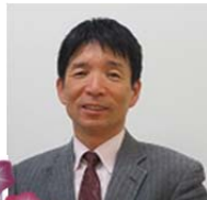
編集責任者 松本幸雄

毎日多くの変化がやってきます。それに対応するだけでも大変ですが、そこに大きなチャンスがあることを信じて、実行するのも楽しいことです。