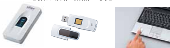
【指紋認証機器の例】

その他、セキュリティに関するシステム構築を外部へ委託したり、ISOやプライバシーマークの取得と同時にシステムの構築を依頼したりと、上手く専門コンサルタントを活用できる例が増えています。