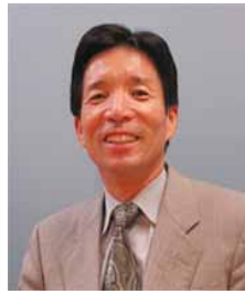
編集責任者 松本幸雄

株式会社マネジメントセンター 〒310-0836 茨城県水戸市元吉田町 1041-4 サン・ビルディング2F TEL029-246-4671 FAX029-246-4672 URL : http://www.isommc.com/