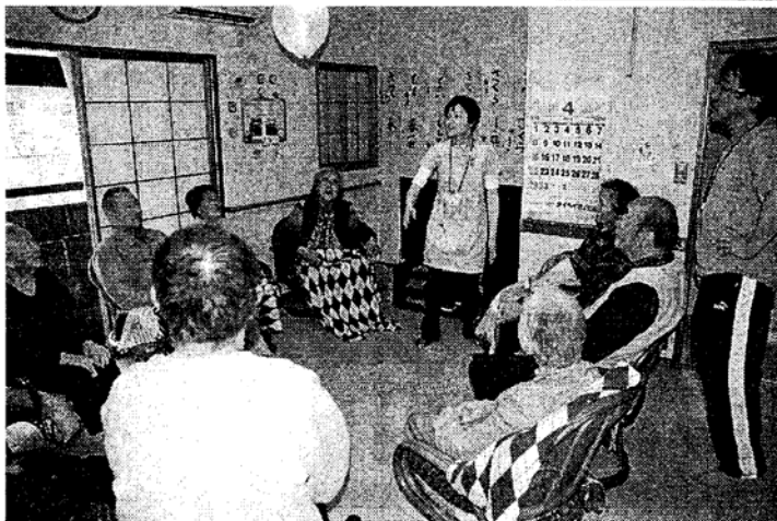
同社のデイサービス「ら」とし、FC展開する施設の名称は「野ばら」。デイサービスは、