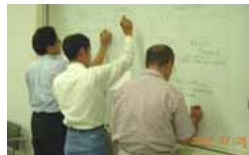
討議した結果を発表しています