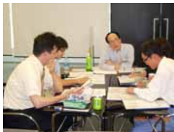
グループ討議の様様です