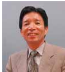
編集責任者 松本幸雄

暑かった夏もようやく峠を越した感じがする最近の気候です。これから、収穫の秋ですが、皆様の会社ではどんな収穫が期待されるのでしょうか。種まき、手入れが決め手かもしれません。