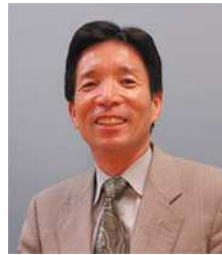
編集責任者 松本幸雄