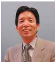
編集責任者 松本幸雄