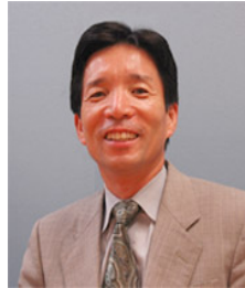
編集責任者 松本幸雄